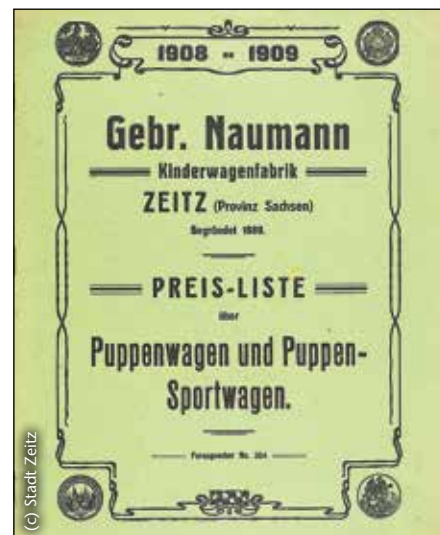
Vorderseite des Katalogs der Gebrüder Naumann von 1909