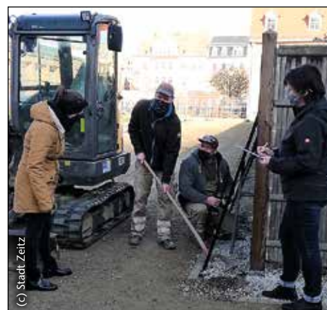
Reparaturen am Zaun des Japanischen Gartens im November 2020

Vielen Dank an die Spender und den Förderverein Landesgartenschau Zeitz 2004 e.V. für die Unterstützung.