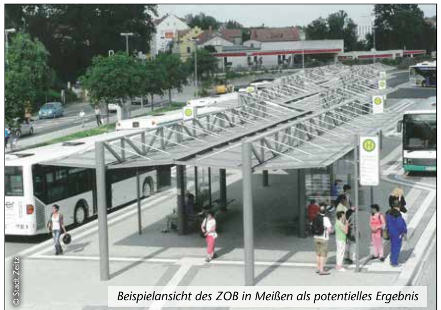
Beispielansicht des ZOB in Meißen als potentielles Ergebnis