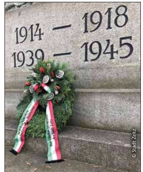
Kranzniederlegung zum Volkstrauertag am 15. November 2020

Auch Oberbürgermeister Christian Thieme hat für die Stadt Zeitz anlässlich des Volkstrauertags am 15. November 2020 einen Kranz am Michaelisfriedhof niedergelegt und der Opfer gedacht. Aufgrund der coronabedingten Einschränkungen durfte der Volkstrauertag nicht als Veranstaltung durchgeführt werden.