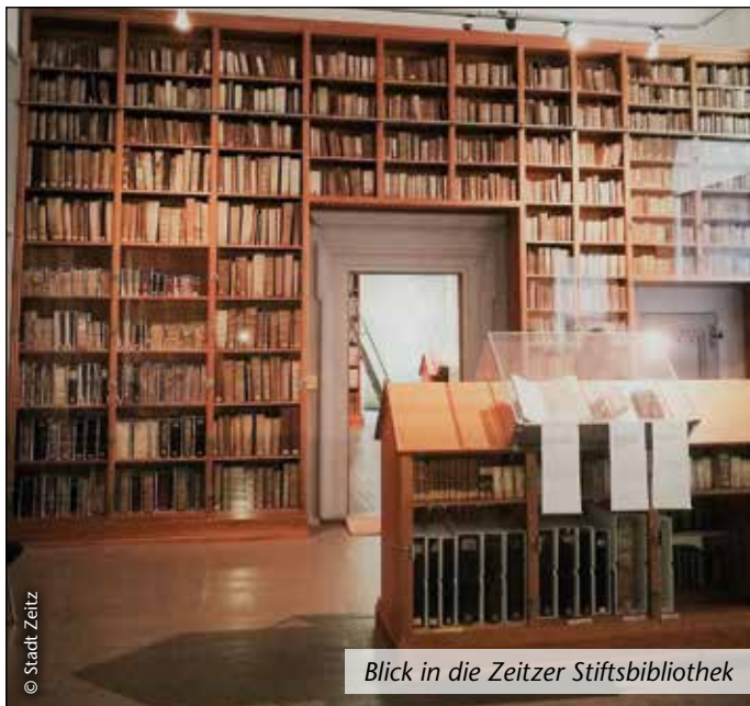
Blick in die Zeitzer Stiftsbibliothek

Unser herzlicher Dank gilt allen Mitwirkenden sowie den Vereinigten Domstiftern zu Merseburg und Naumburg und des Kollegiatstifts Zeitz für die tolle Initiative sowie den BesucherInnen für ihr reges Interesse.