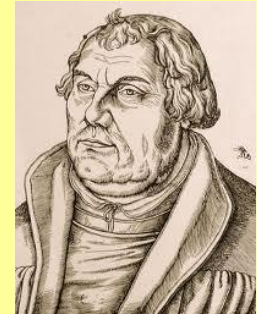
Martin Luther (1483- 1545)